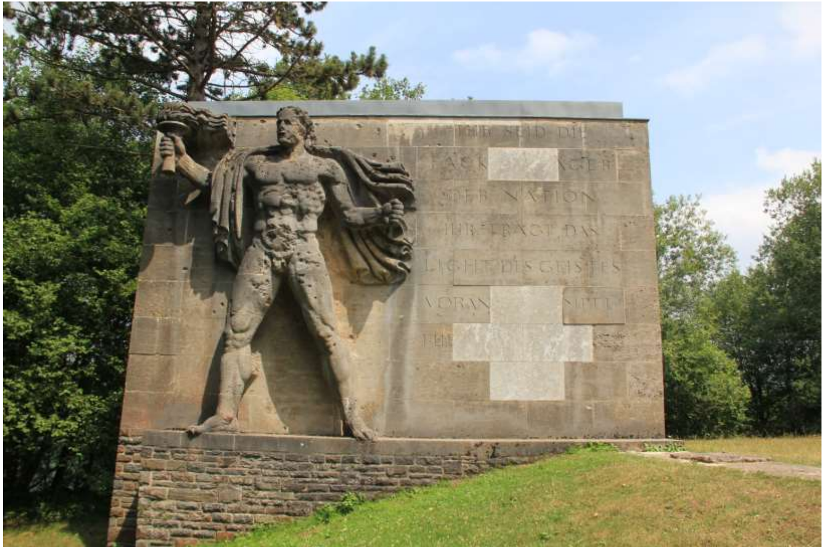
Fackelträgerrelief und Sonnenwendplatz