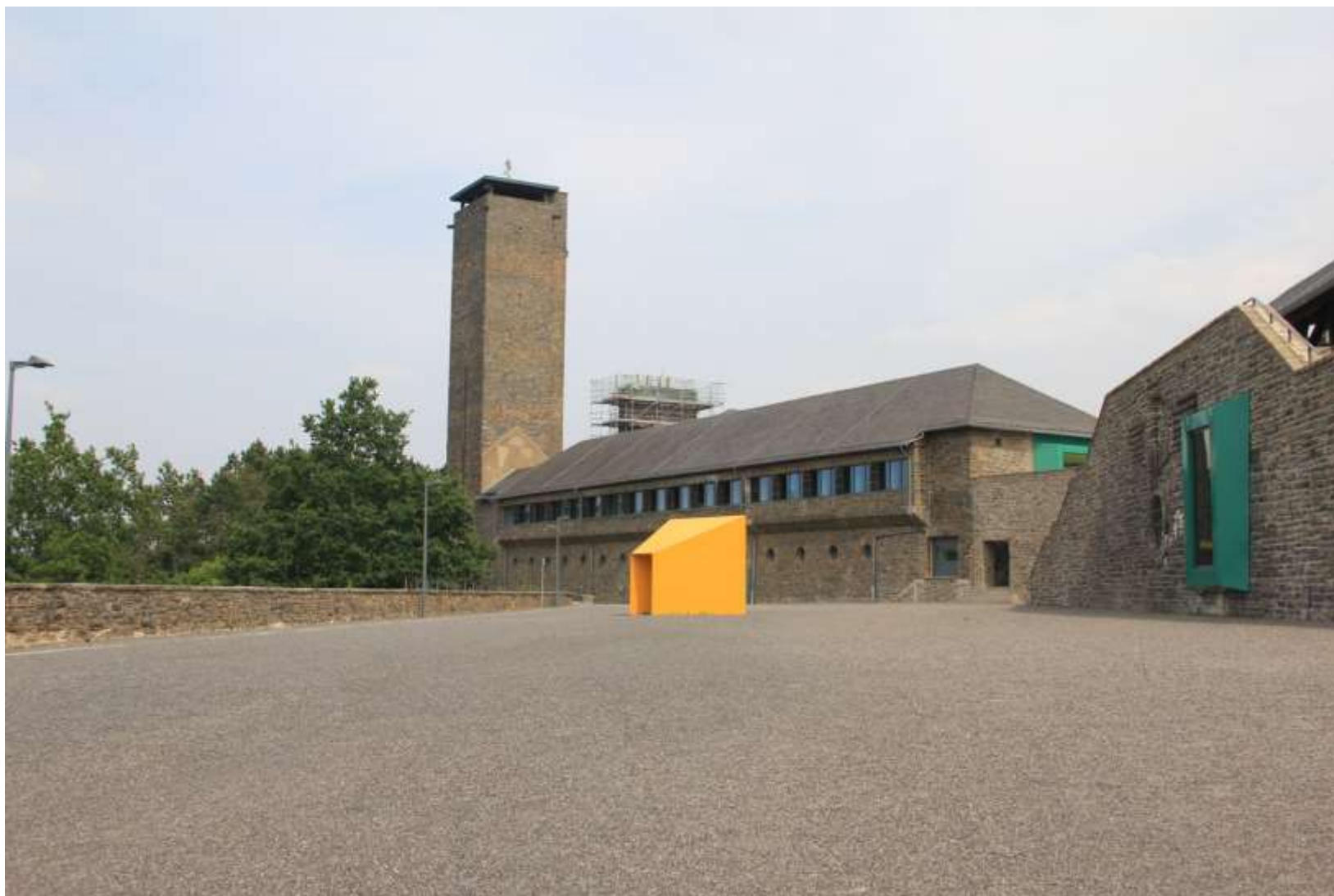
Turm mit Ehrenhalle