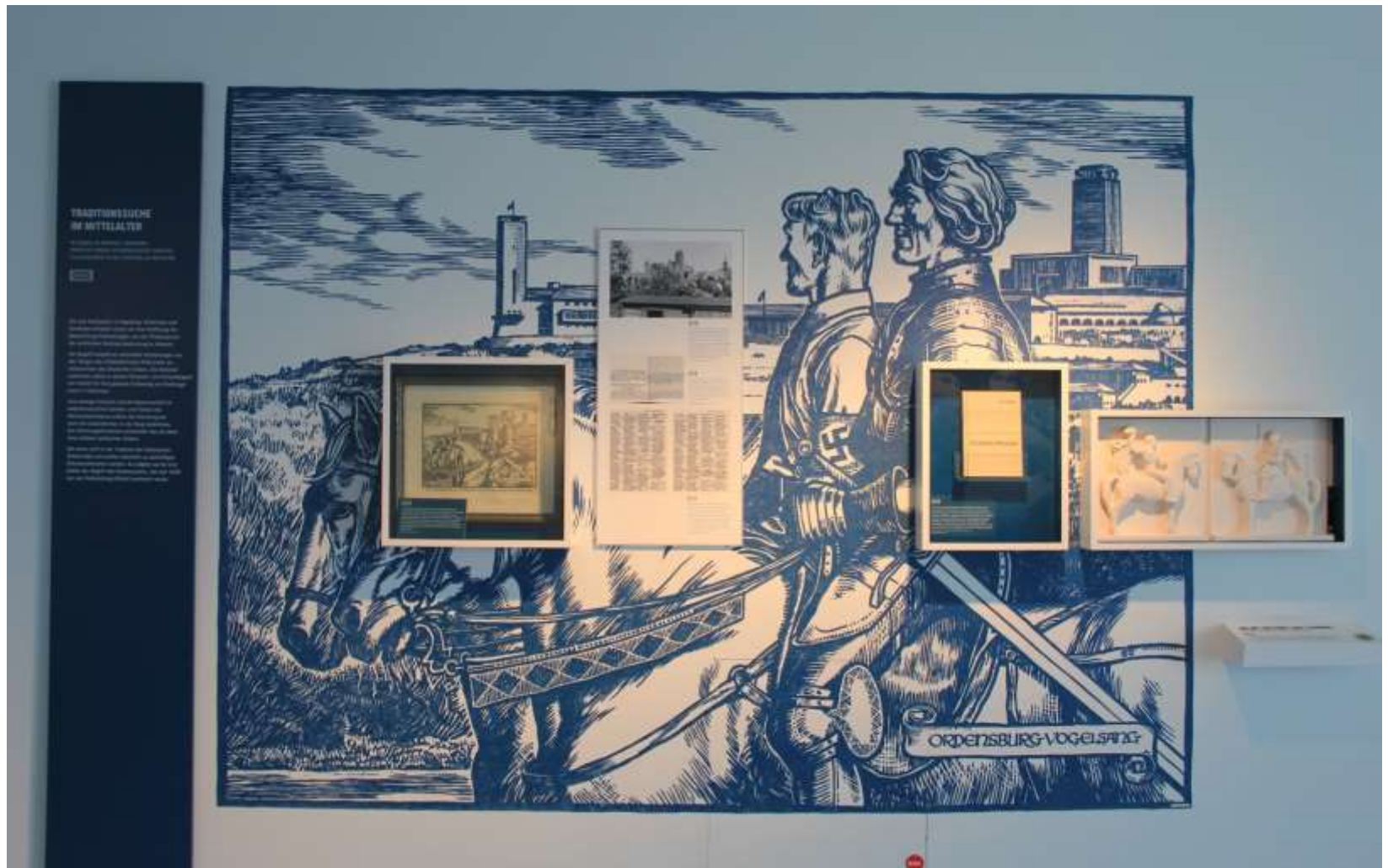
Die Ausstellung „Bestimmung: Herrenmensch“