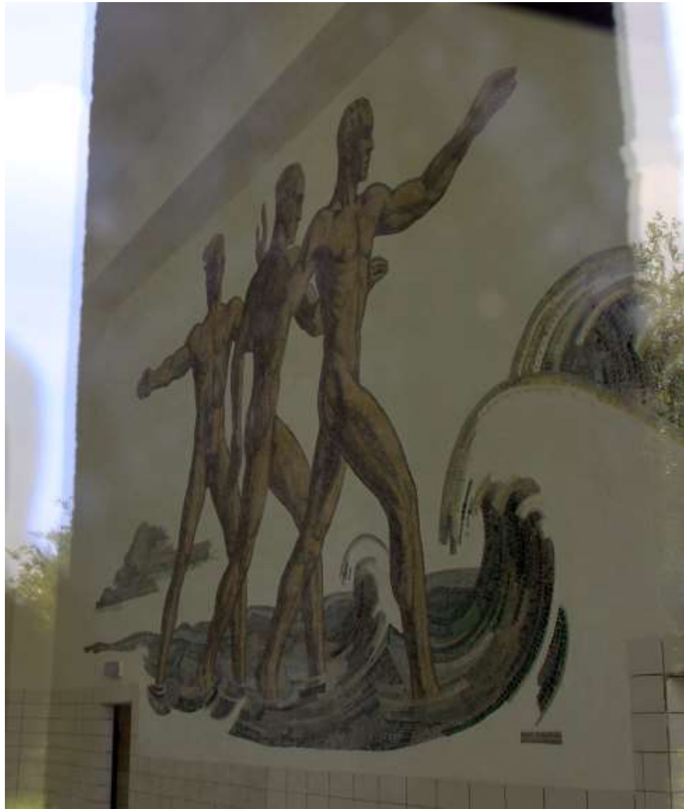
Relief in der Schwimmhalle