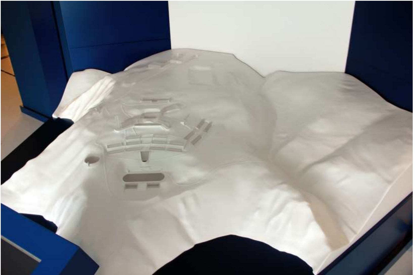
Modell der Gesamtanlage